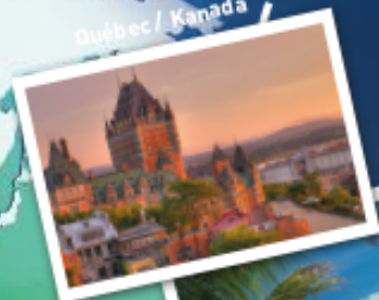
Québec / Kanada