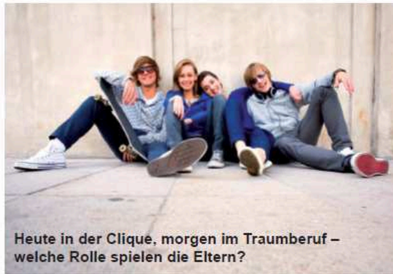
Heute in der Clique, morgen im Traumberuf – welche Rolle spielen die Eltern?

Bei der Frage, für welchen Beruf sich Jugendliche entscheiden, sind Eltern die wichtigsten Ratgeber. Niemand kennt die Stärken und Schwächen des eigenen Kindes besser. Dennoch ist die Berufswahl keine einfache Angelegenheit, auch für Eltern nicht. Das Wissen ist vielleicht nicht mehr auf dem neuesten Stand.