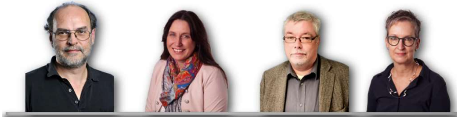
Die akademischen Berater/innen der Agentur für Arbeit Osnabrück